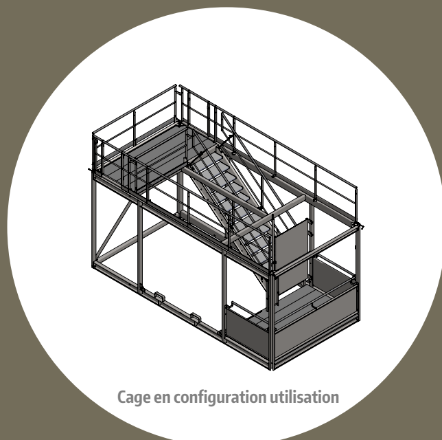
Cage en configuration utilisation

Descriptif non exhaustif. Certains composants, matériaux, traitements peuvent être modifiés.