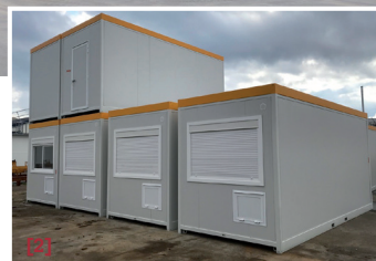
[1] Bâtiment Flexone. [2] Modules.

À noter enfin que les équipes de BCI assurent le montage des éléments sur site partout en France. ■